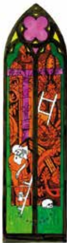
Alberola Vierge au pied de la croix

En collaboration avec le Centre National des Arts Plastiques et les ateliers des maîtres-verriers Duchemin (Paris), Parot (Dijon) et Thomas (Valence)