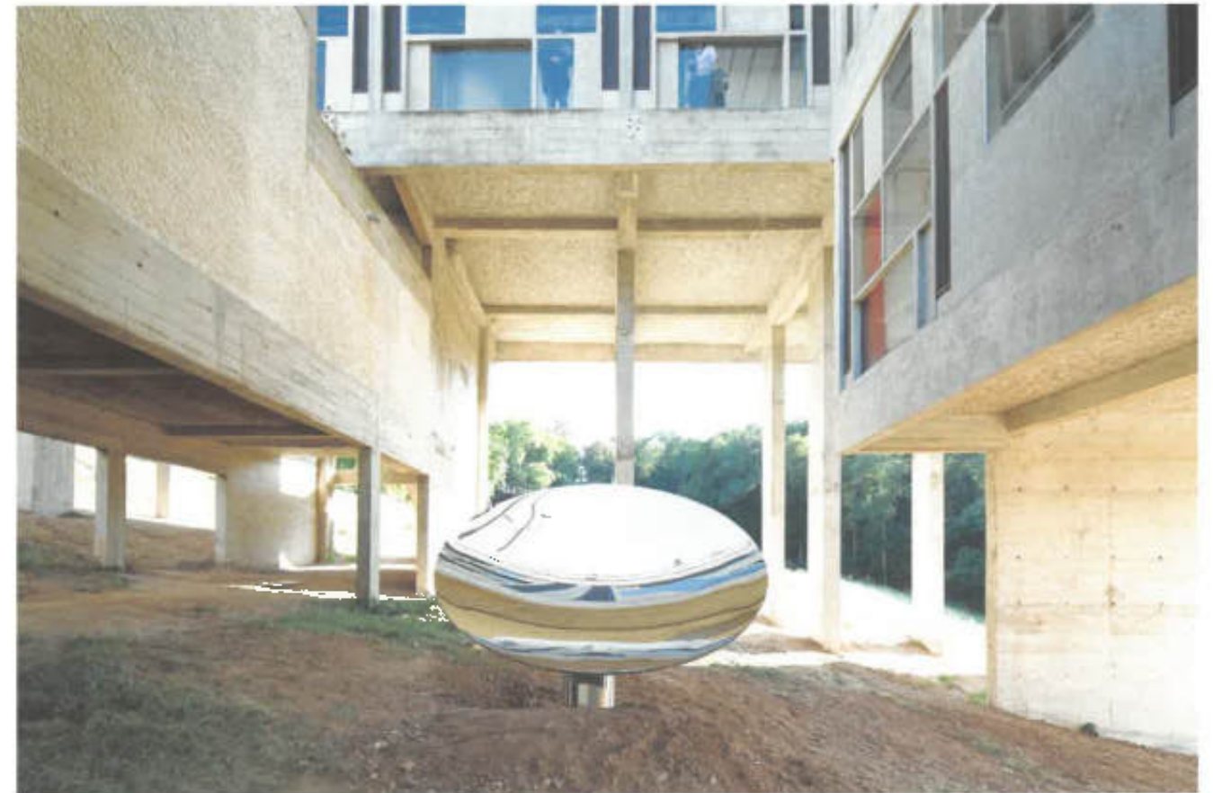
ANISH KAPOOR exhibition