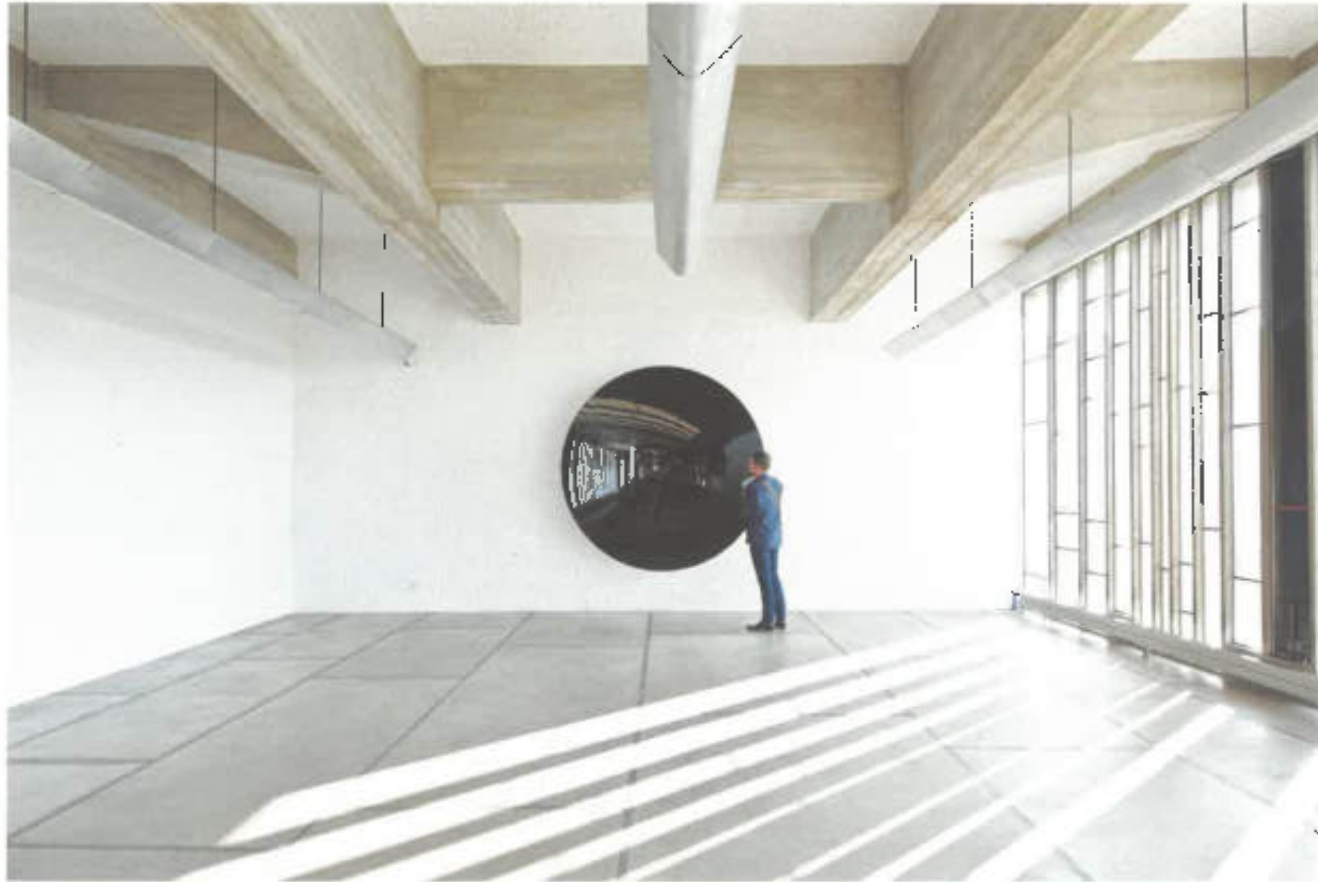
ANISH KAPOOR exhibition, photographed by JONATHAN LE TOUBLON